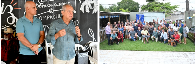
Guarapari - 07 /11/2025