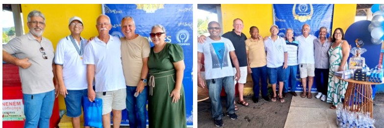
Alegre - 06/12/2025