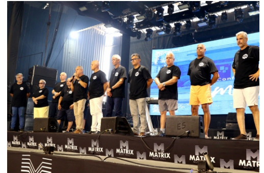
Confraternização da Sede na Matrix Music Hall

Encerramos o ano de 2025 com um calendário de confraternizações intenso de norte a sul do estado, nos meses de novembro e dezembro, marcado pela alegria e união da família militar, culminando na maior e melhor festa dos últimos anos, realizada na Grande Vitória.