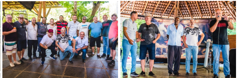
Colatina - 30/11/2025