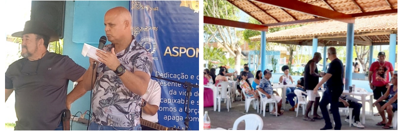
S3o Mateus - 22/11/2025