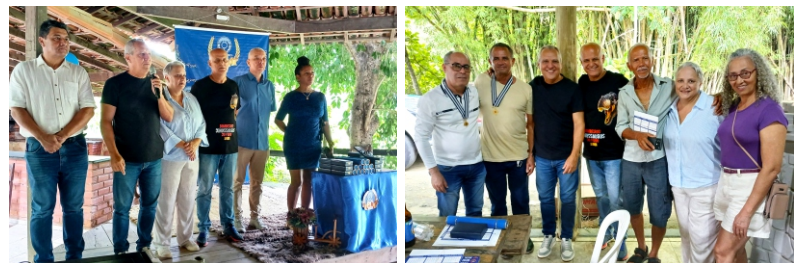
Cachoeiro - 5/12/2025