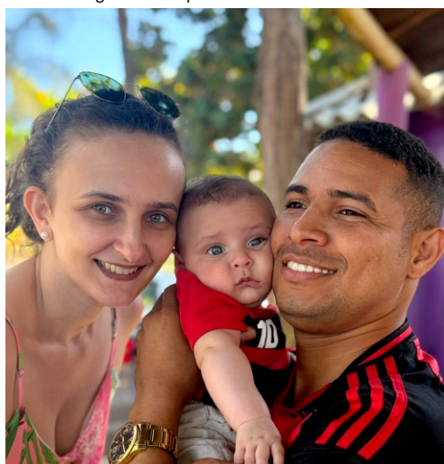
Mais uma família atendida pelo Auxílio Natalidade