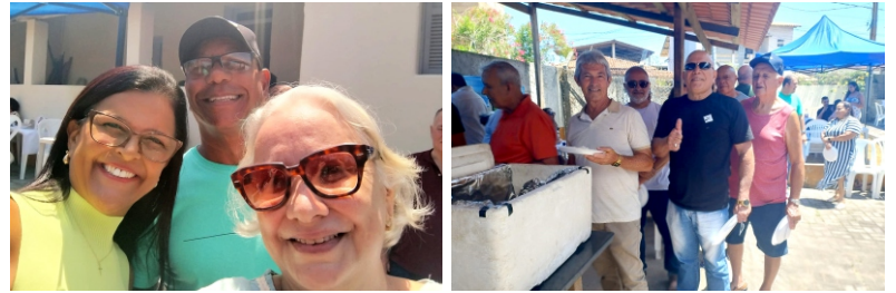
Matarai3es - 28/11/2025