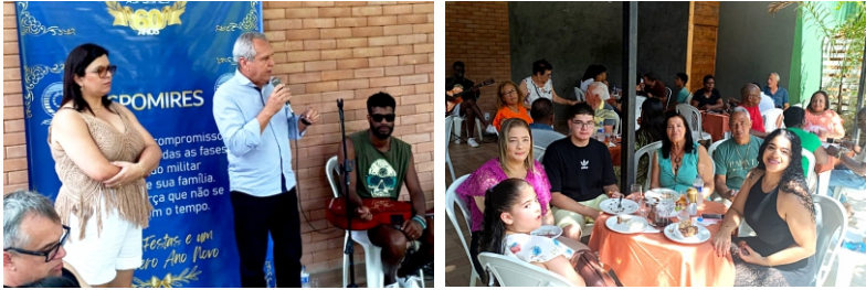
Guaçu3 - 22 /11/2025