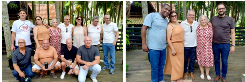
Iúna - 29 /11/2025