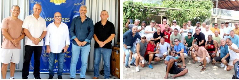
Linhares - 16 /11/2025