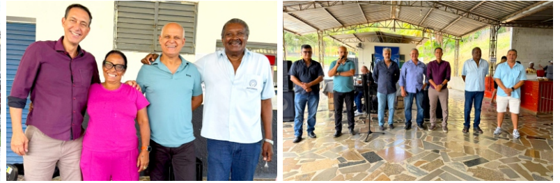
Barra de São Francisco - 14/11/2025