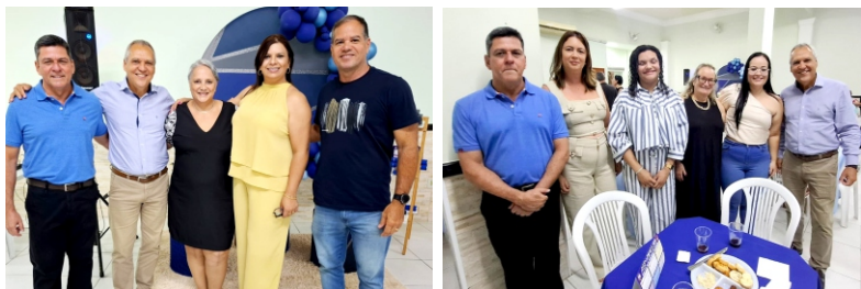
ABC - 03/12/2025