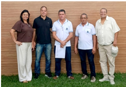
Representantes das Regionais do Sul - ES

A Diretoria Sul possui representação em alguns municípios e em seu entorno, tais como: Alegre (Alegre, Dolores do Rio Preto, Guaçuí e Jerônimo Monteiro), Bom Jesus do Norte (Aplacá, Bom Jesus do Norte e São José do Calçado), Cachoeiro de Itapemirim (Atilio Vivacqua, Cachoeiro de Itapemirim, Castelo, Mimoso do Sul, Muqui e Vargem Alta), Iúna (Brejetuba, Ibatiba, Ibitirama, Iúna e Muniz Freire) e Marataízes (Iconha, Itapemirim, Marataízes, Presidente Kennedy e Rio Novo do Sul). Com isso, leva a cada um dos municípios citados um atendimento humanizado e presente, que faz da ASPOMIRES uma instituição de referência.