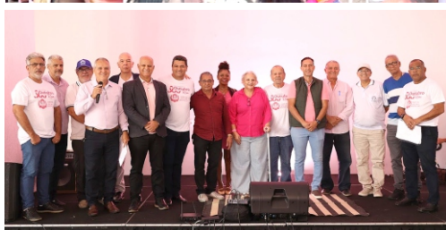
Celebração do Outubro Rosa na Aspomires