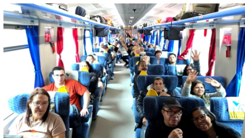
Viagem com associados para o Sítio Mania do Lago em Resplendor - MG

Que o ano que se inicia nos traga novas ideias e projetos de sucesso para a satisfação dos nossos associados e pensionistas, nosso maior patrimônio.